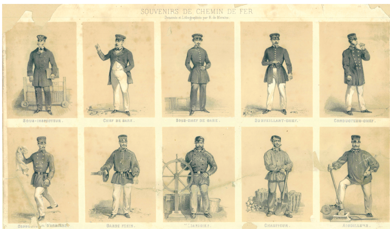
Lithographie du 19 ème siècle

Visitez la Bretagne, affiches de 1965 Visitez la Bretagne avec les trains et les autocars de la Société nationale des chemins de fer français