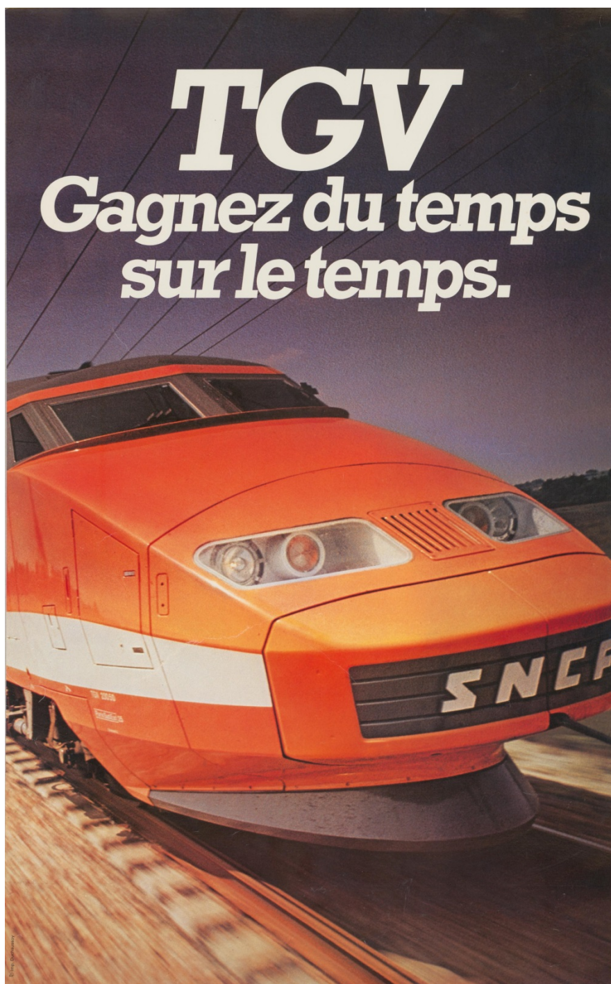
Publicité TGV : Gagnez du temps sur le temps